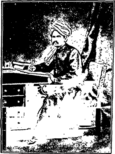
- ॥ आङ्ग्लदेशे गङ्करः ॥-